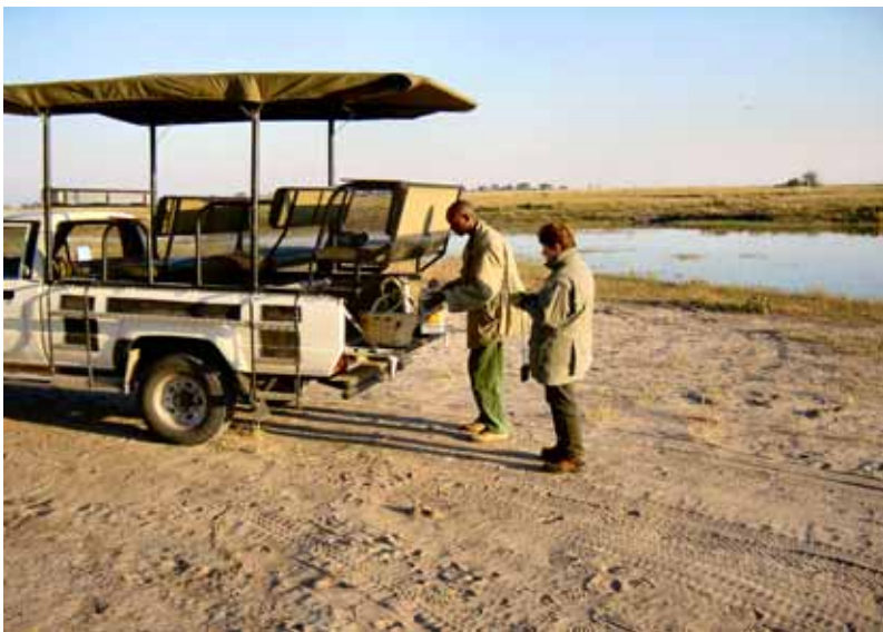
Pause mit heißen Getränken und Keksen